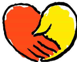
Grafik: Pfeffer

REINHARD ELLSEL zum Monatsspruch Juli 2012: Mit welchem Maß ihr messt, wird man euch wieder messen. Markus 4,24