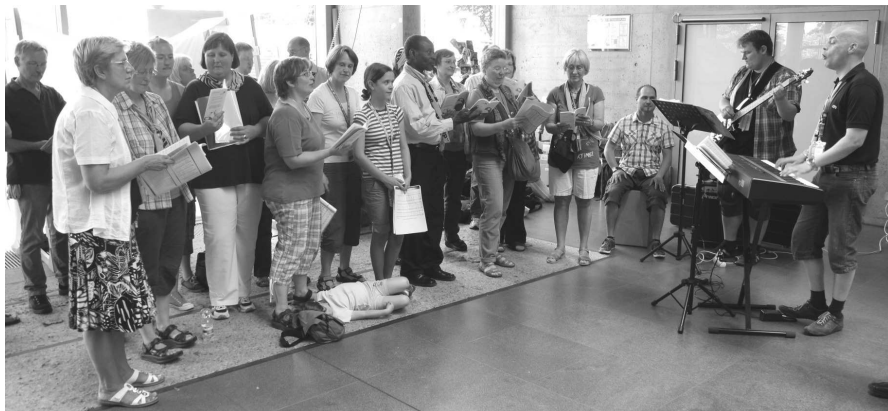
Der Projektchor der Evangelischen Kirchengemeinde Oer-Erkenschwick bei seinem Auftritt in der Technischen Universität.

Nach einem sonnigen Abschluss-Gottesdienst mit 120.000 Menschen am Elbufer verabschiedet sich der Evangelische Kirchentag elbabwärts